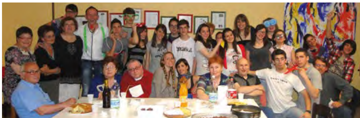
Ricordo di una magnifica serata trascorsa nella sede Aism di Legnago dove il gruppo adolescenti di Sanguinetto ha devoluto parte del ricavato della Santa Notte per il "Progetto Andrea", terapia riabilitativa domiciliare per persone con sclerosi multipla. Gli Animatori

NUOVO CENTRO REVISIONI AUTOFFICINA GOMMISTA ASSETTO RUOTE E SOCCORSO DIELLE CAR