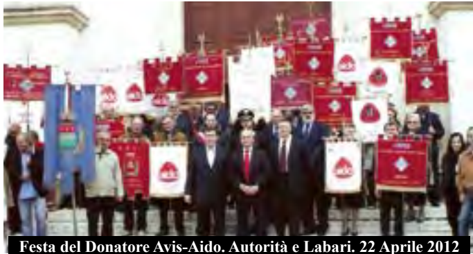
Festa del Donatore Avis-Aido. Autorità e Labari. 22 Aprile 2012