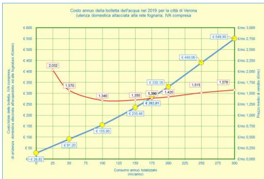
Figura 6 - Costo totale e specifico 2018

In relazione al territorio regionale, le tariffe applicate nella città di Verona danno come risultato il costo totale annuo della bolletta più basso in assoluto. Le tariffe dell'Area del Garda, in linea con le tariffe dell'Area Veronese, rimangono tra le più basse della Regione Veneto.