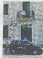
Carabinieri di Legnaro

I militari dell'Arma sono arrivati a loro grazie ai telefoni che sono stati sequestrati ai due arrestati: una serie di messaggi e telefonate hanno permesso ai carabinieri di strin-