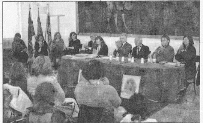
CONCORSO RANDI La premiazione dei ragazzi avvenuta nel 2012

tore della scuola all'aperto "Raggio di Sole" per bambini deboli e malati. A cimentarsi con versi, rime e filastrocche sul tema "Immagina una città" anche gli studenti dell'istituto comprensivo di Saonara, legato all'undicesimo di Padova dallo stesso dirigente scola-