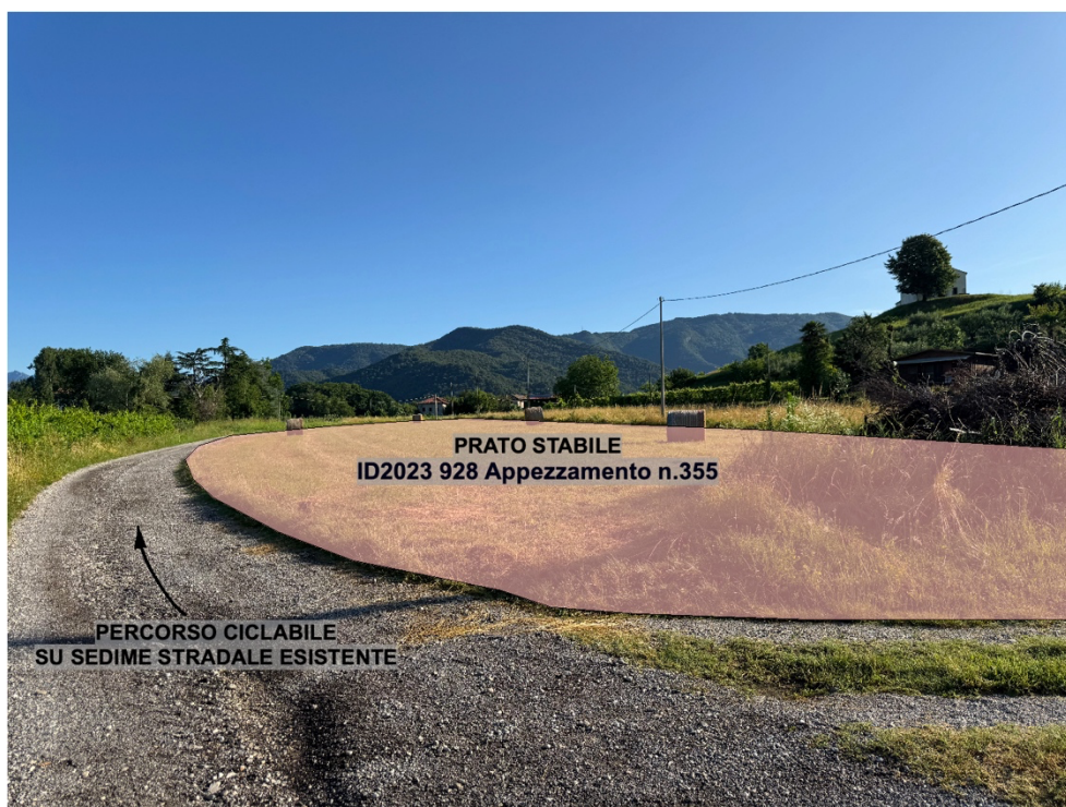
Foto 3 - previsioni di progetto Prato Stabile ID2023 928 Appezamento n.355

Si precisa che durante l'esecuzione dei lavori, al fine di preservarne la totale integrità, l'area in questione sarà adeguatamente segnalata come zone interdetta.