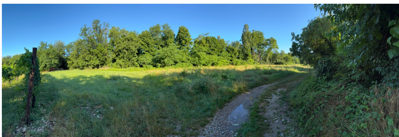
Foto 1 - stato di fatto area Prato Stabile ID2023 2666 Appezamento n. 356

Sulla base di quanto sopra esposto non vi sarà riduzione di superficie, né vi saranno interferenze in fase di cantiere.