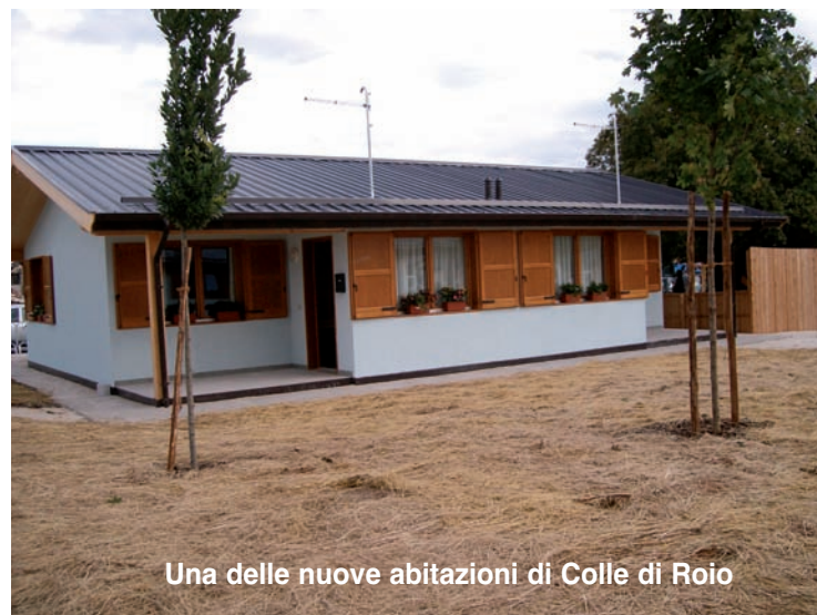
Una delle nuove abitazioni di Colle di Roio