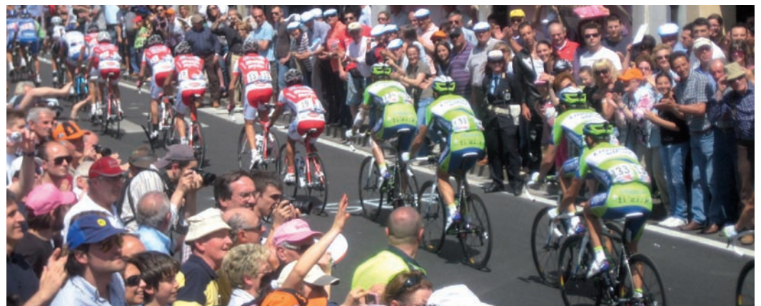
Nella foto, il passaggio del gruppo nel centro storico di Camposampiero, dov'era posizionato il traguardo volante.

Un serpente ininterrotto di appassionati ha salutato a Campodarsego, San Giorgio delle Pertiche, Camposampiero e Loreggia , la carovana del Giro ed i campioni del pedale, sabato 22 maggio, in occasione del passaggio della 14ª tappa del Giro d'Italia, la Ferrara - Asolo, lungo le strade del Camposampierese. Straordinaria, a detta degli stessi organizzatori della Gazzetta dello Sport, l'accoglienza riservata ai girini, a testimonianza della passione per il ciclismo che da sempre è viva nel territorio.