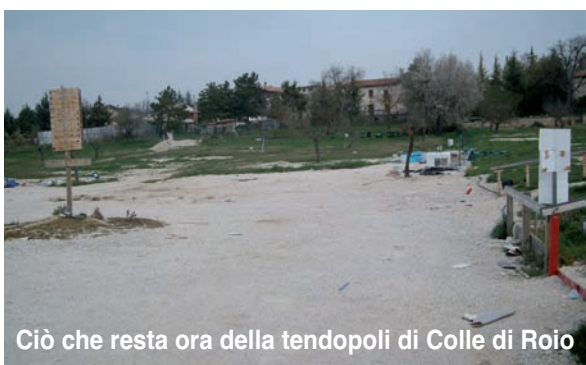
Ciò che resta ora della tendopoli di Colle di Roio

persone ed aver condiviso con loro le mille difficoltà ma anche qualche momento di allegria si è instaurato un bellissimo rapporto di amicizia, che si è voluto rinsaldare con questa prima, ma non ultima, visita. Molto è stato fatto per fare in modo che tutti avessero al più presto una casa, ora è necessario impegnarsi affinché il patrimonio artistico sia recuperato, e il volto di questi paesi torni ad essere quello che era prima del 6 aprile.