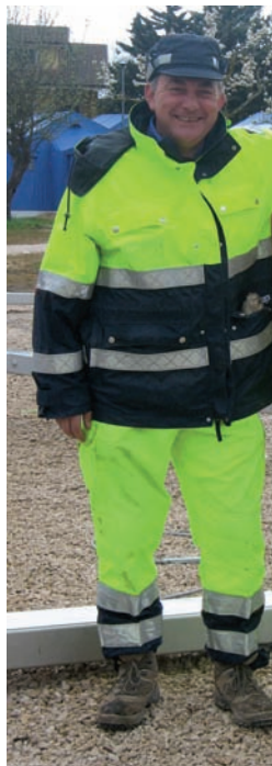
Il coordinatore dell'Unità Locale di Trebaseleghe nonché del Distretto di Protezione Civile del Camposampierese

Fu così che dopo quasi due anni di lavoro per la formazione tecnica dei volontari del gruppo Comunale per attività di