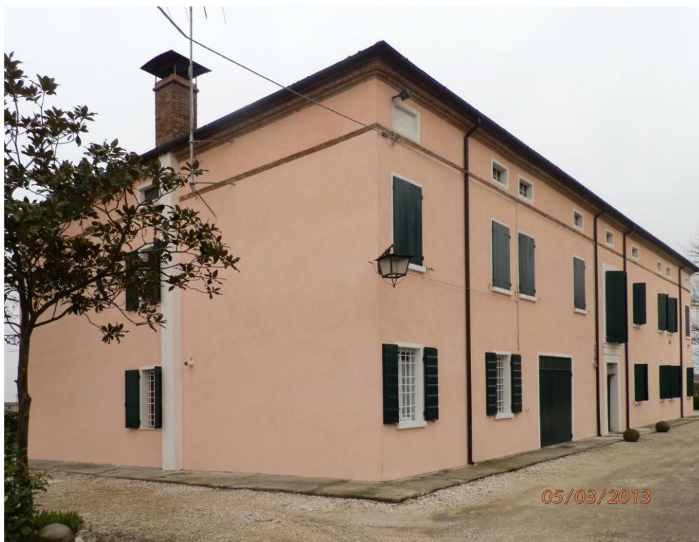
Oggetto Fabbricato ad uso abitazione (1): fronti est e nord