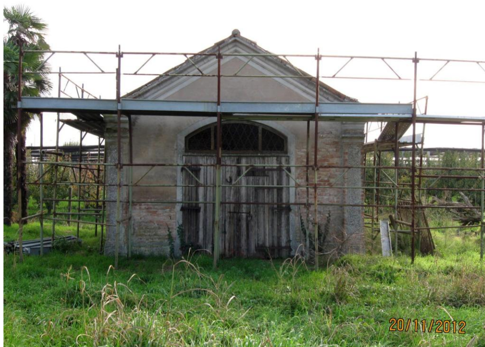
Oggetto Fabbricato ad uso proservizi (4): fronte nord-est