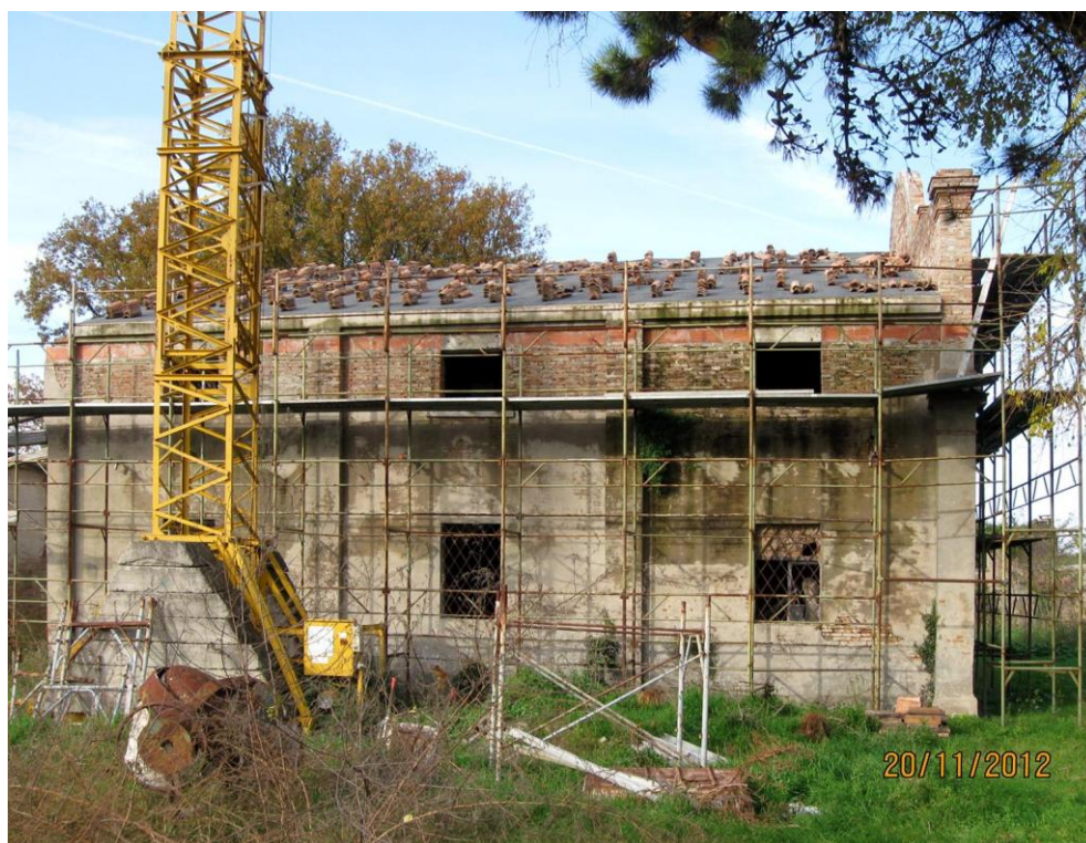
Oggetto Fabbricato ad uso agricolo (3): fronte nord-est