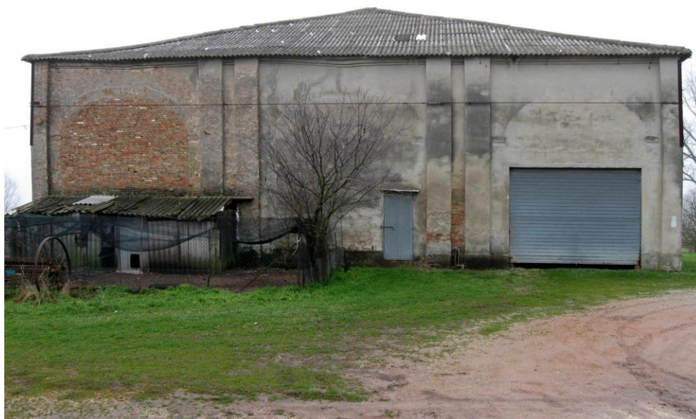
Oggetto Fabbricato ad uso ex stalla-fienile (6): fronte sud