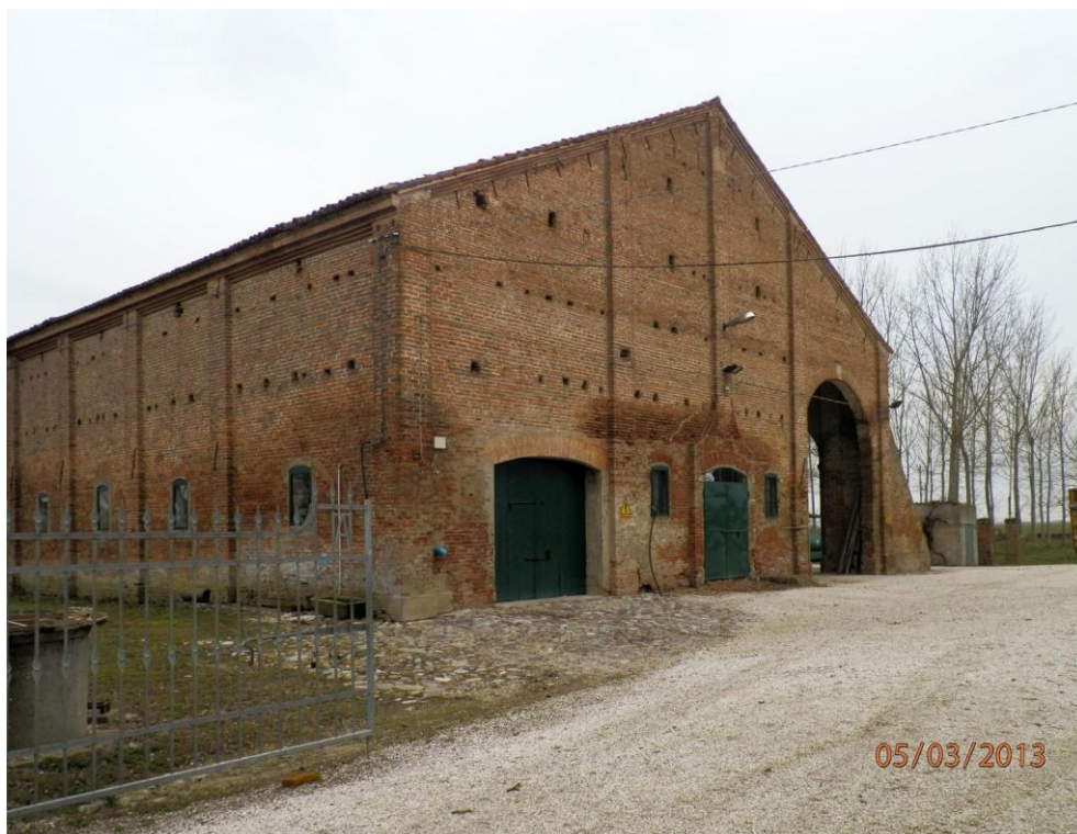
Oggetto Fabbricato ad uso ex stalla-fienile (2): fronti nord-ovest e sud-ovest