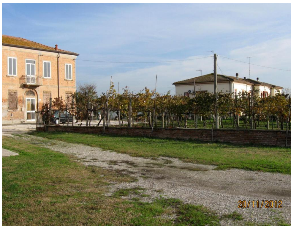
Oggetto Fabbricato ad uso specialistico (2): fronte sud