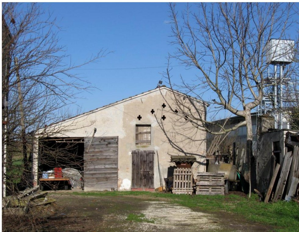
Oggetto Fabbricato ad uso proservizi (8): fronte sud