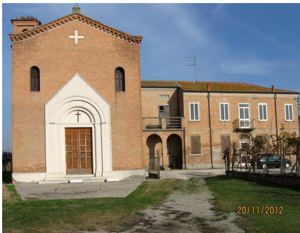
Oggetto Fabbricato ad uso specialistico (1): fronte sud