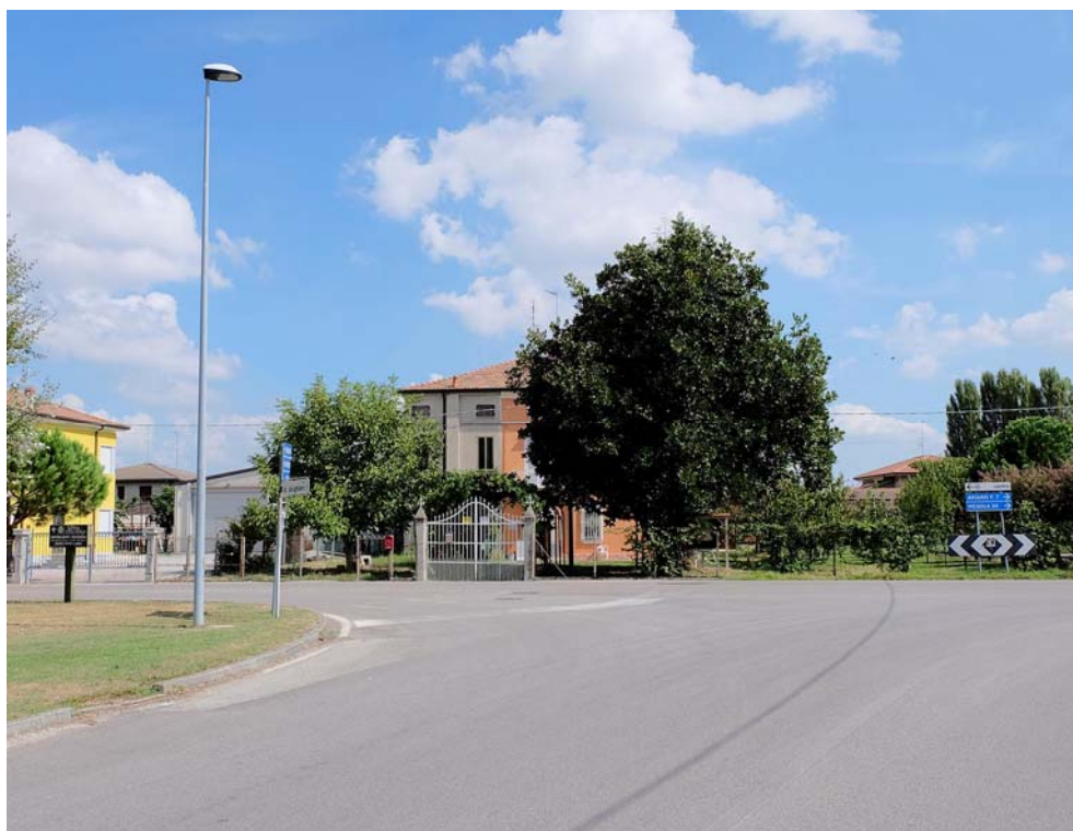
Oggetto Vista panoramica della corte