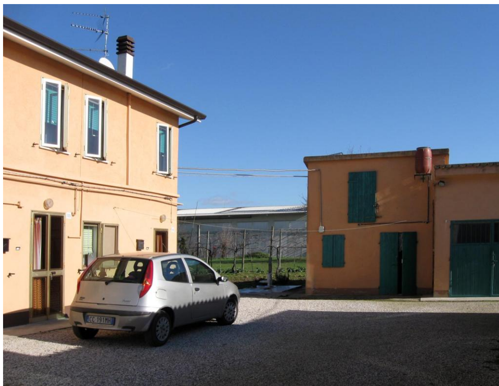
Oggetto Fabbricato ad uso abitazione (3): porzione del fronte sud Fabbricato ad uso proservizi (4): fronte ovest