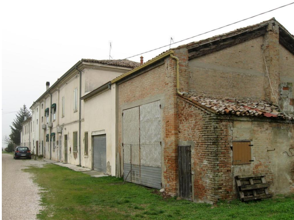
Oggetto Fabbricati ad uso residenziale (1) (2): fronte sud Fabbricato ad uso ex agricolo (3) e fabbricato ad uso ex proservizi (4): fronte sud