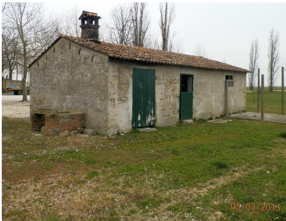
Oggetto Fabbricato ad uso proservizi (3): fronti nord-ovest e sud-ovest