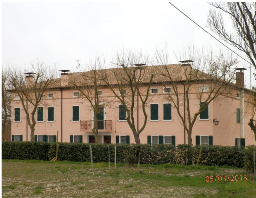
Oggetto Fabbricato ad uso abitazione (1): fronte sud