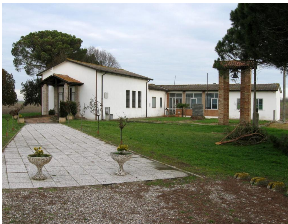
Oggetto Vista panoramica del complesso