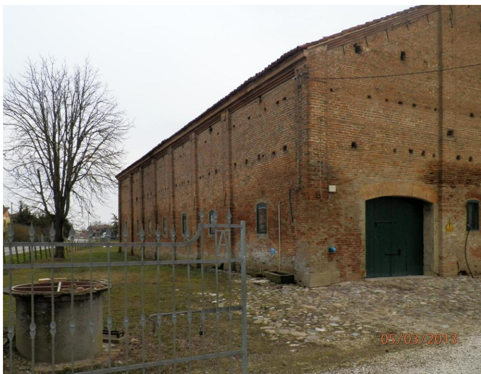
Oggetto Fabbricato ad uso ex stalla-fienile (2): fronte nord-ovest