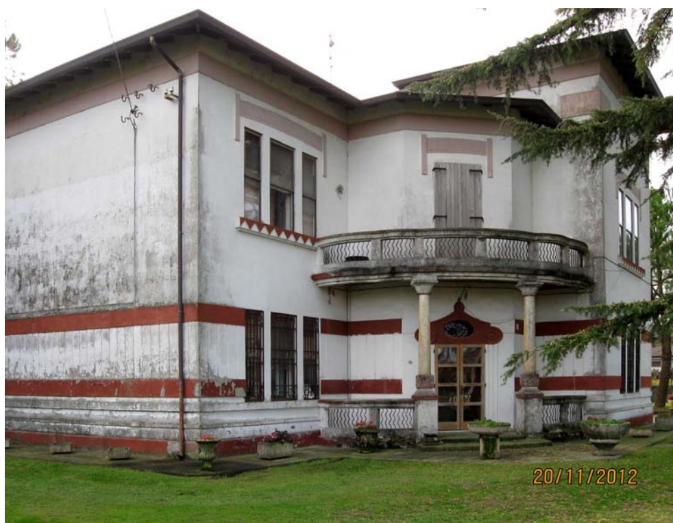
Oggetto Fabbricato ad uso abitazione (1): fronte nord