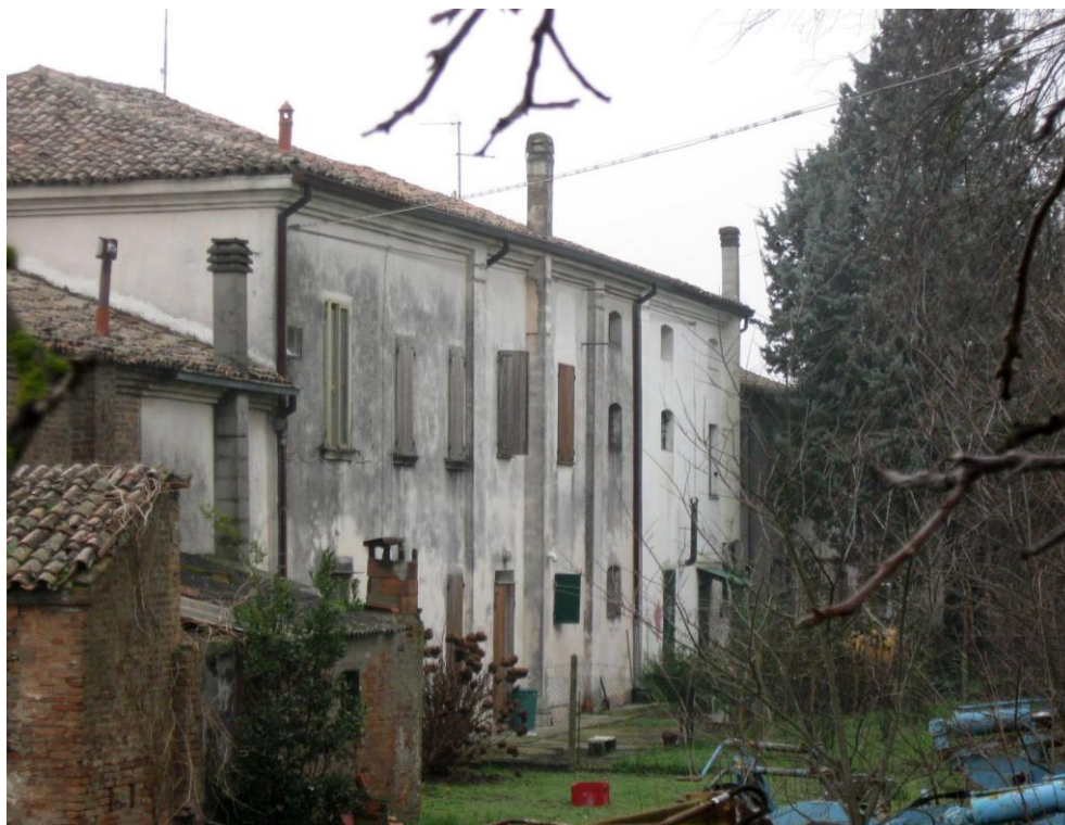
Oggetto Fabbricato ad uso residenziale (1): fronte nord