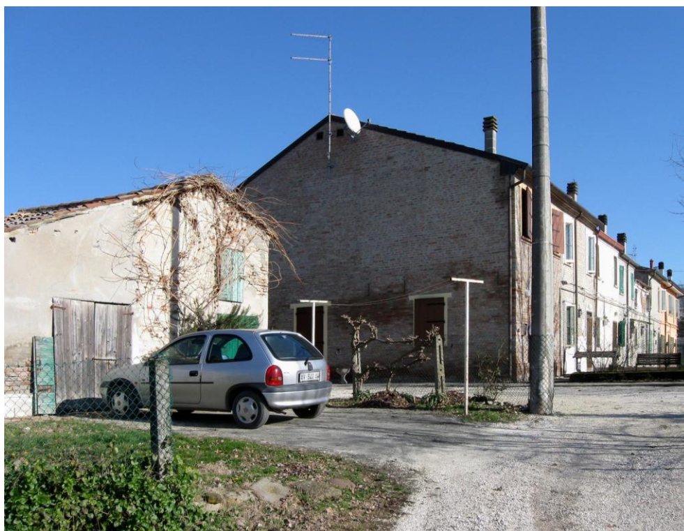
Oggetto Fabbricato ad uso abitazione (2): fronti ovest e sud Fabbricato ad uso proservizi (3): fronte sud