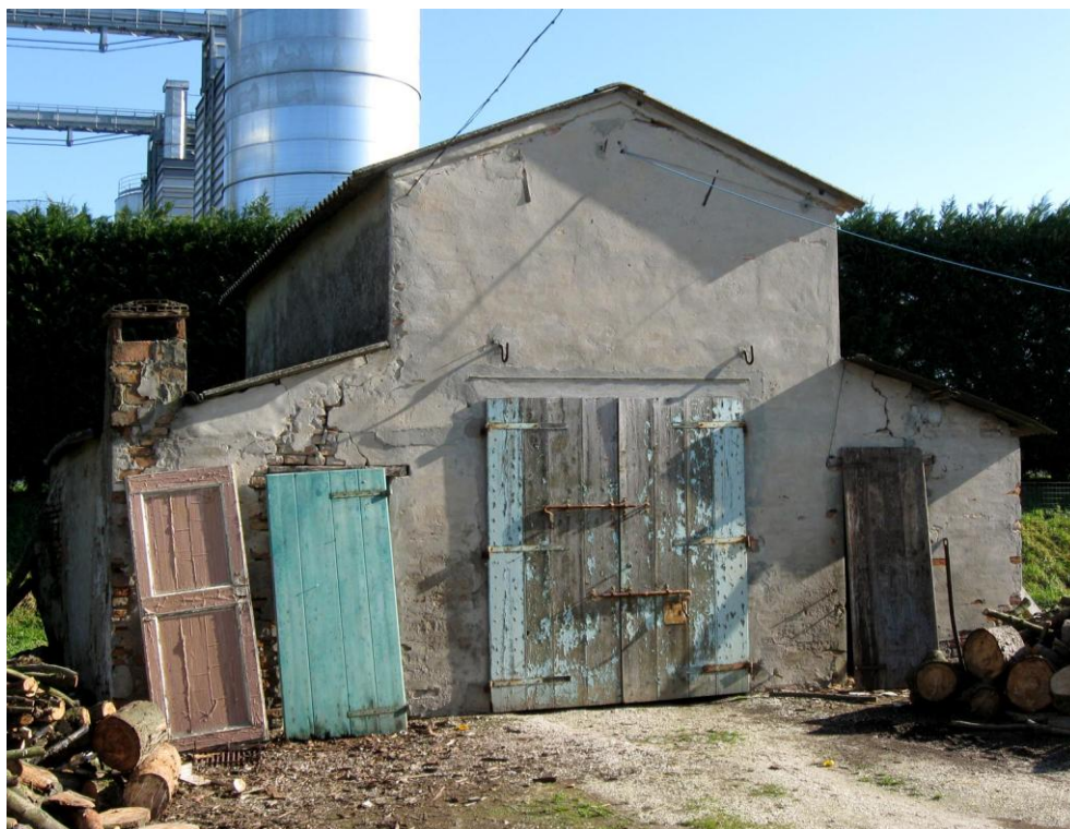
Oggetto Fabbricato ad uso proservizi (9): fronte ovest