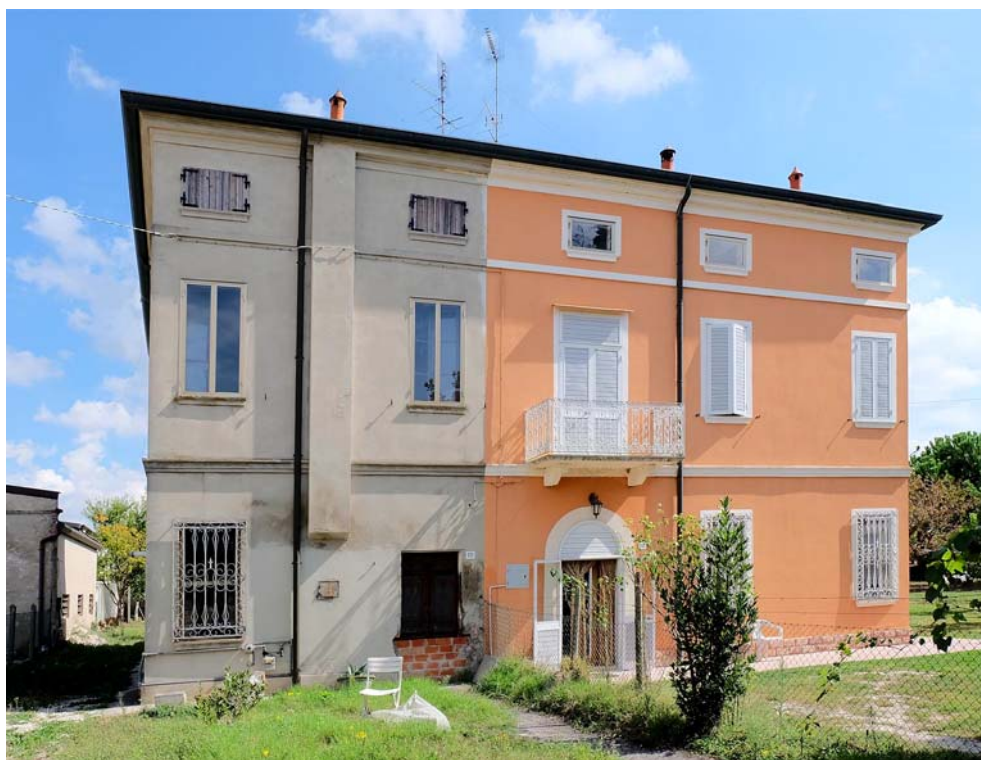
Oggetto Fabbricato ad uso abitazione (1): fronte ovest