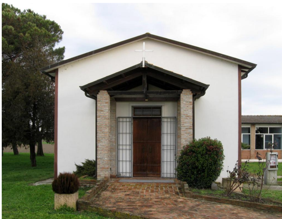
Oggetto Fabbricato ad uso specialistico (1): fronte sud