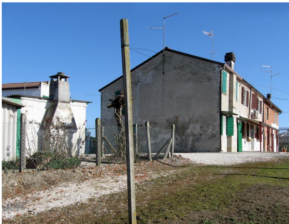
Oggetto Fabbricato ad uso abitazione (1): fronti ovest e sud