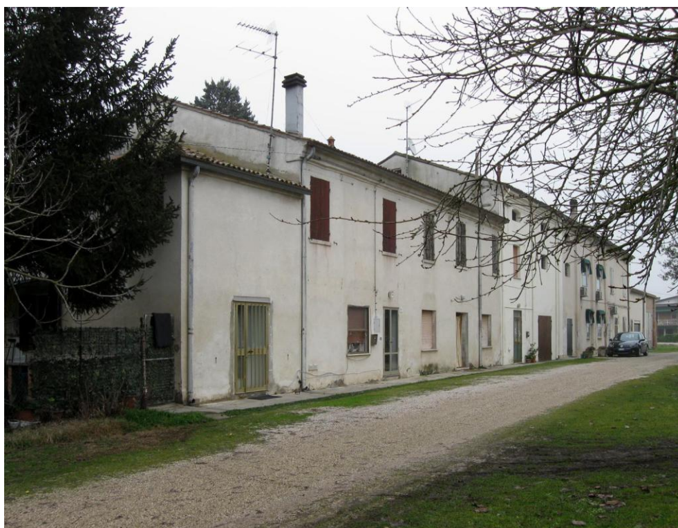
Oggetto Fabbricati ad uso residenziale (1) (2): fronte sud Fabbricato ad uso ex agricolo (3): fronte sud