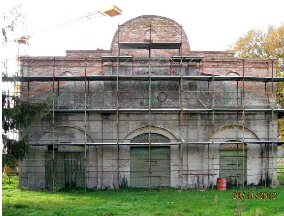
Oggetto Fabbricato ad uso agricolo (3): fronte nord-ovest