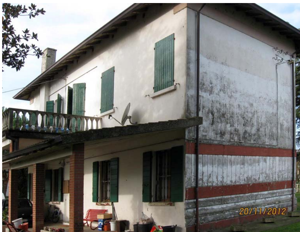
Oggetto Fabbricato ad uso abitazione (1): fronte sud-est