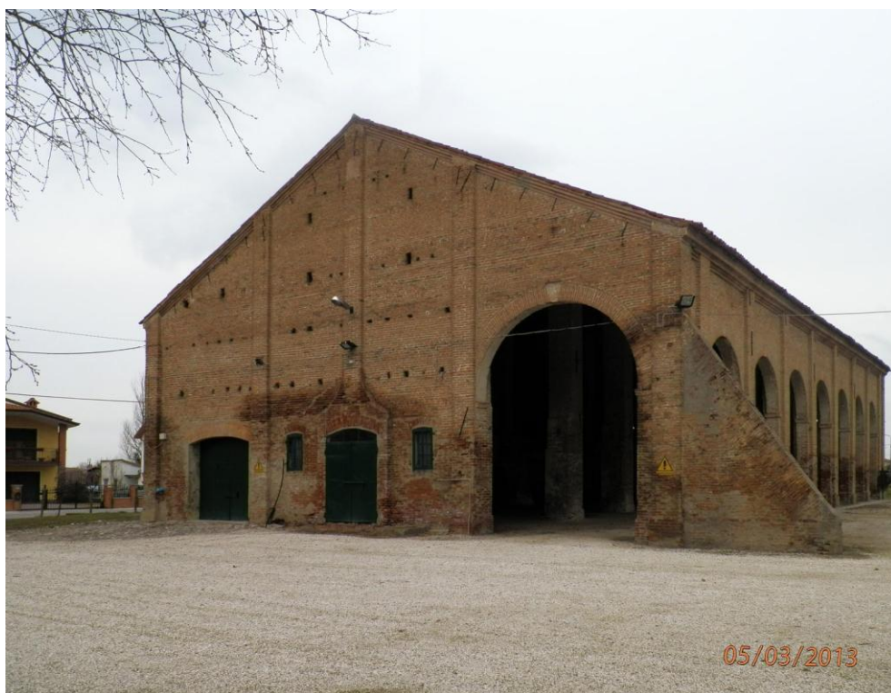
Oggetto Fabbricato ad uso ex stalla-fienile (2): fronti sud-ovest e sud-est