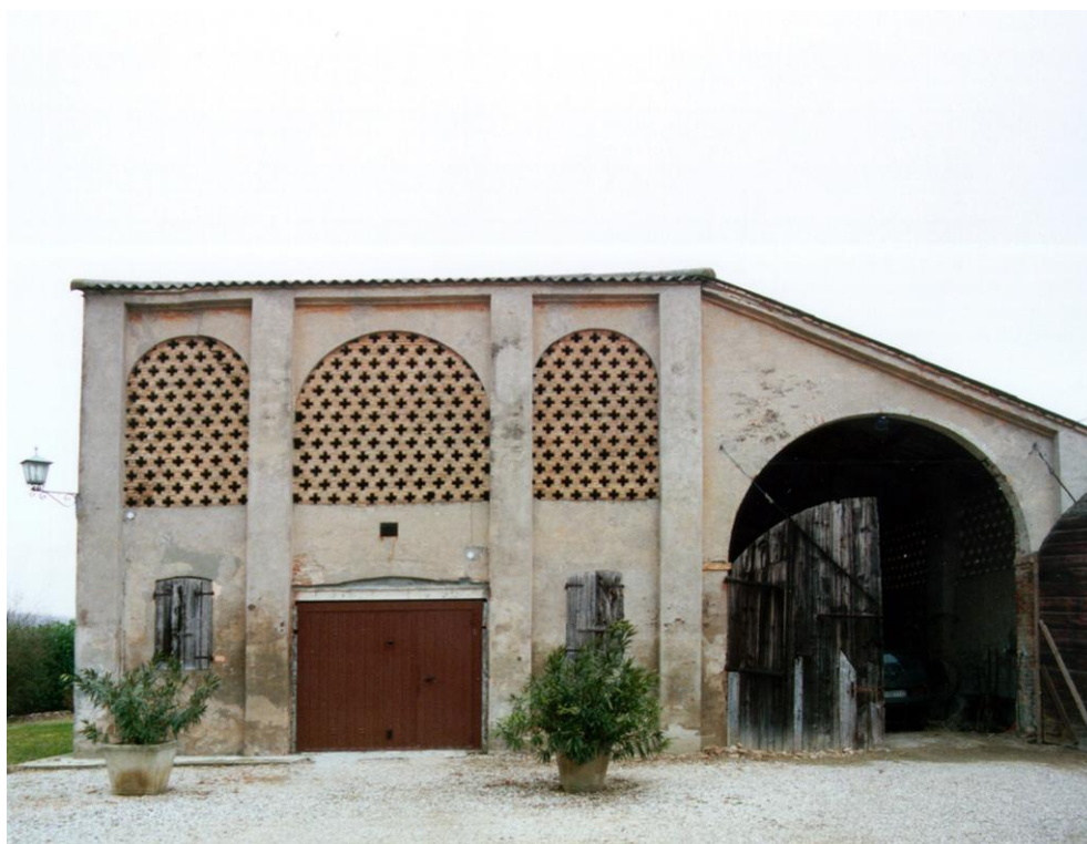
Oggetto Fabbricato ad uso ex stalla-fienile (4): fronte ovest