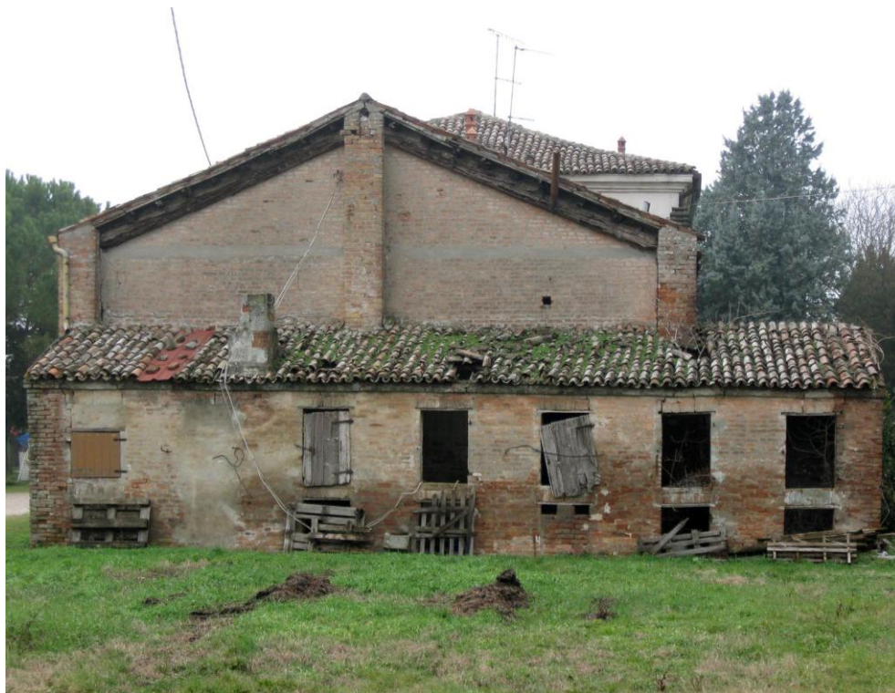
Oggetto Fabbricato ad uso ex proservizi (4): fronte est