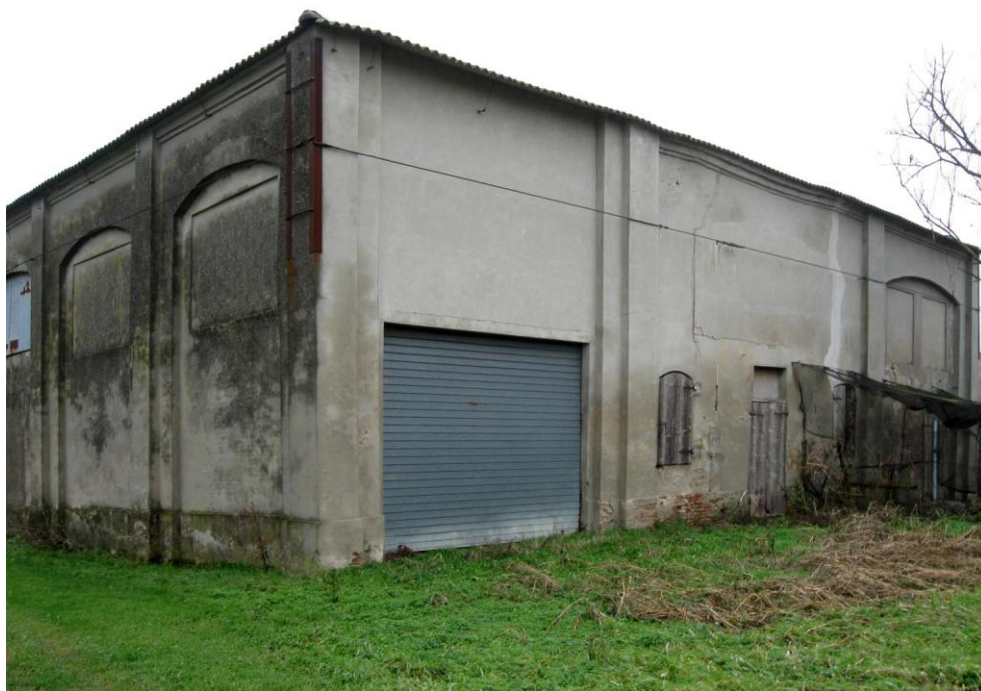
Oggetto Fabbricato ad uso ex stalla-fienile (6): fronti sud ed ovest