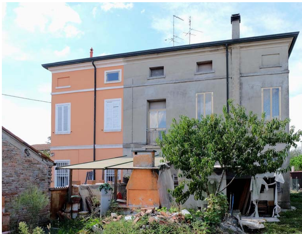
Oggetto Fabbricato ad uso abitazione (1): fronte est