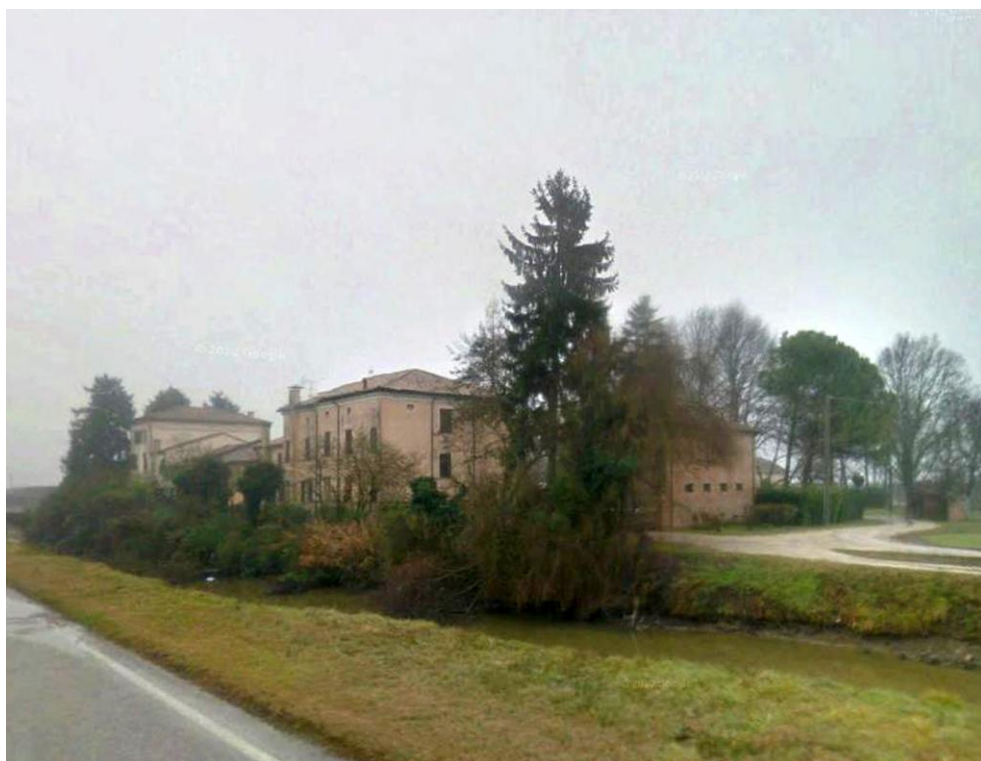
Oggetto Vista panoramica della corte