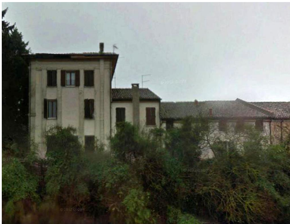
Oggetto Fabbricati ad uso abitazione (1) (2) (3): fronti nord