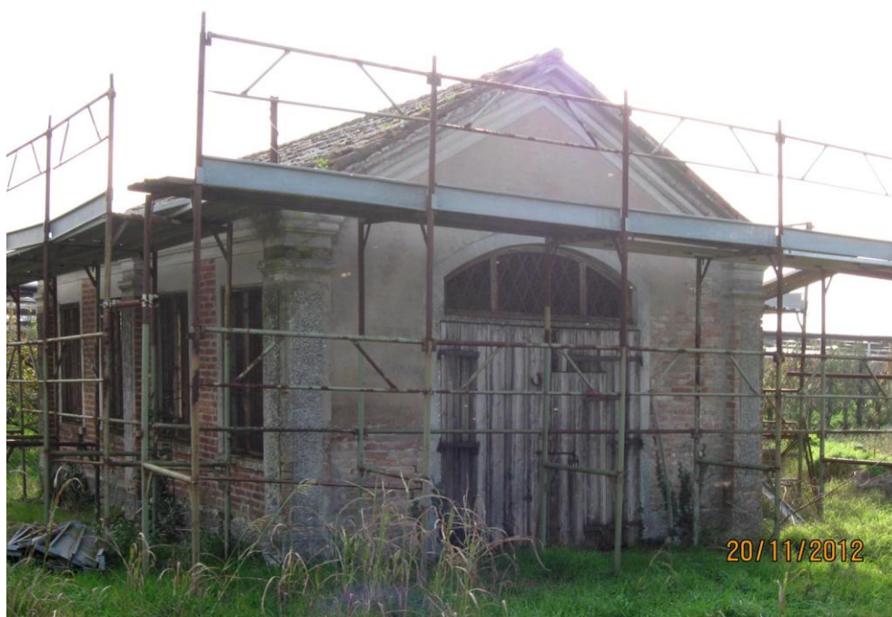
Oggetto Fabbricato ad uso proservizi (4): fronti nord-ovest e nord-est