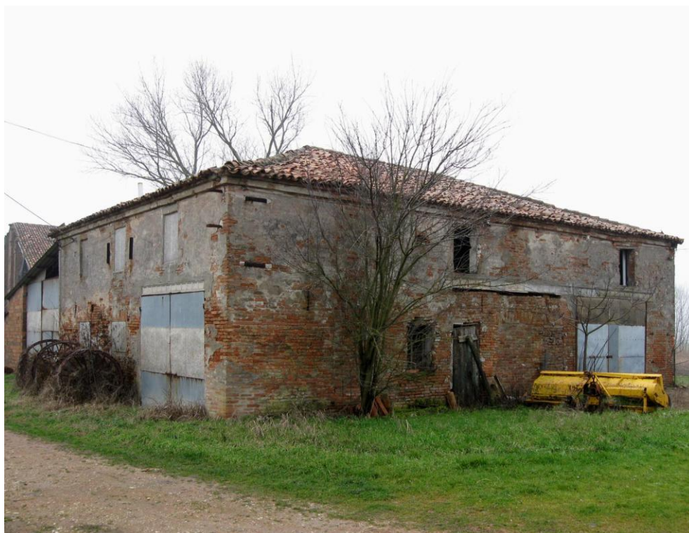
Oggetto Fabbricato ad uso ex stalla-fienile (7): fronti est e nord