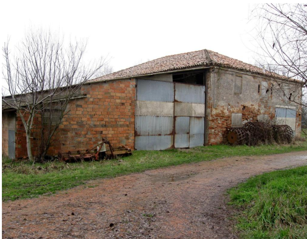
Oggetto Fabbricato ad uso ex stalla-fienile (7): fronte est