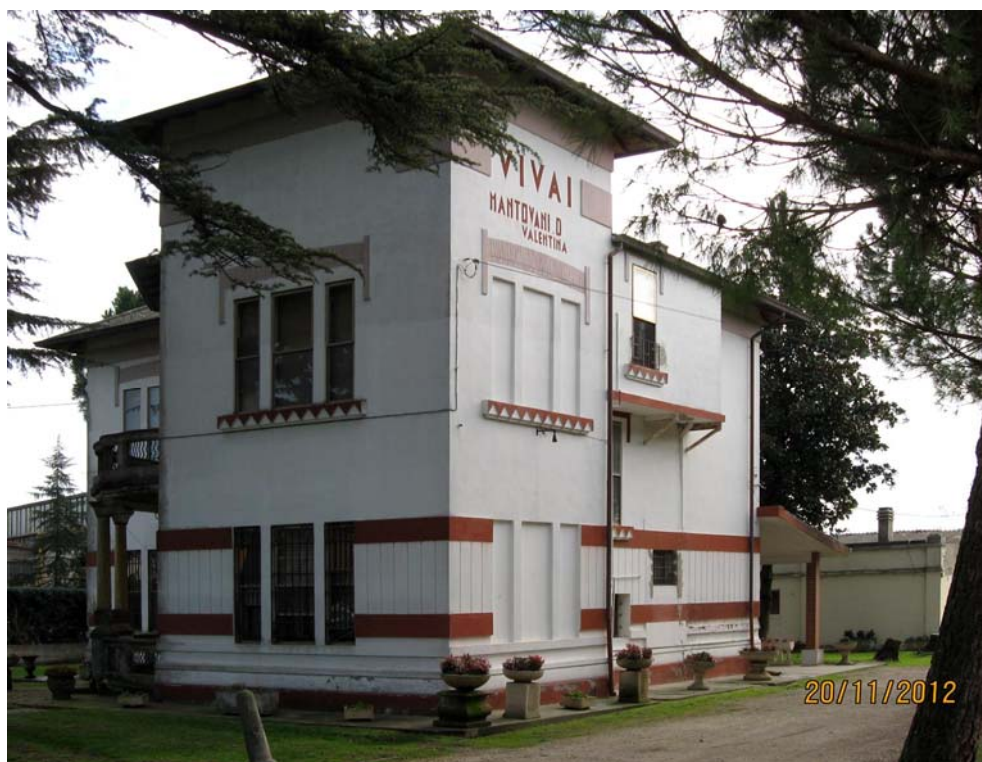
Oggetto Fabbricato ad uso abitazione (1): fronti nord-ovest e sud-ovest