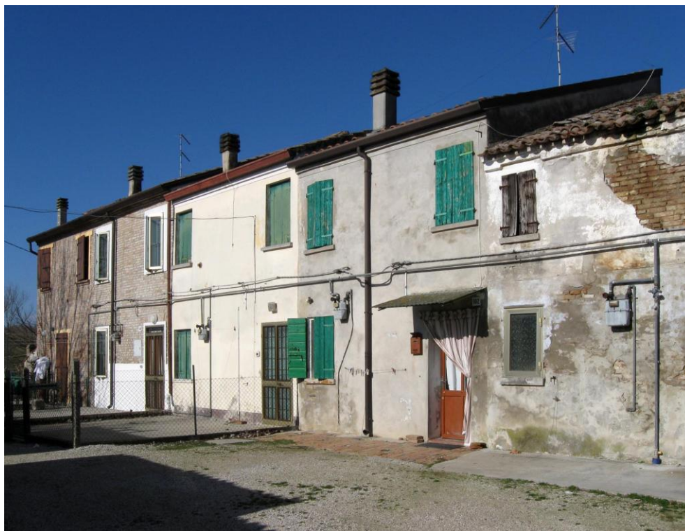
Oggetto Fabbricato ad uso abitazione (3): fronte sud