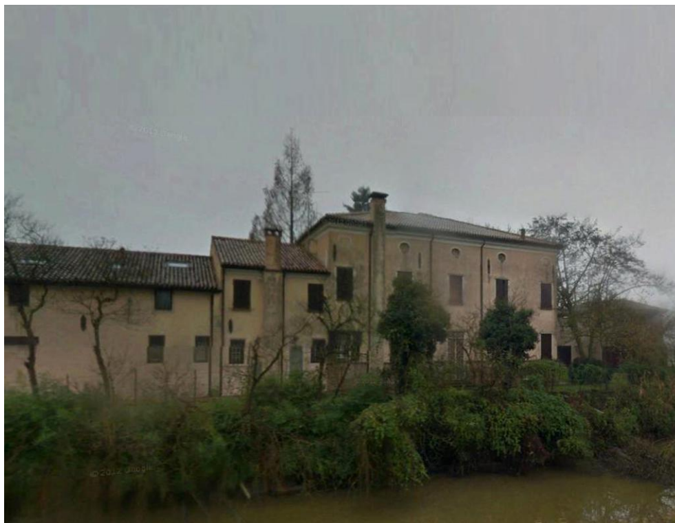
Oggetto Fabbricati ad uso abitazione (3) (4) (5): fronti nord