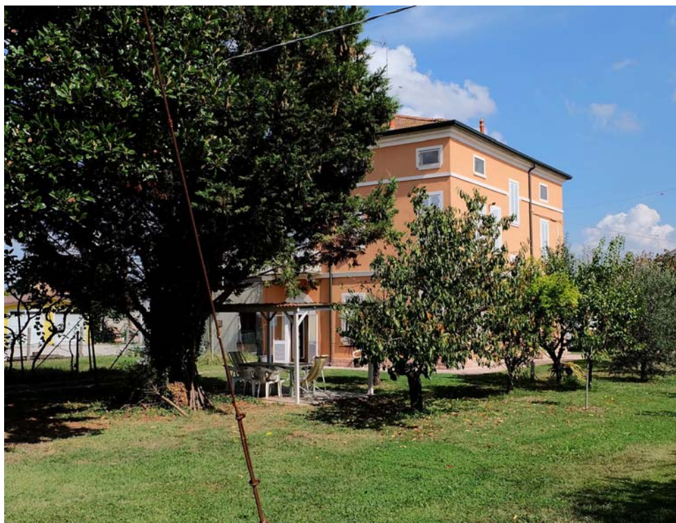
Oggetto Fabbricato ad uso abitazione (1): fronti ovest e sud