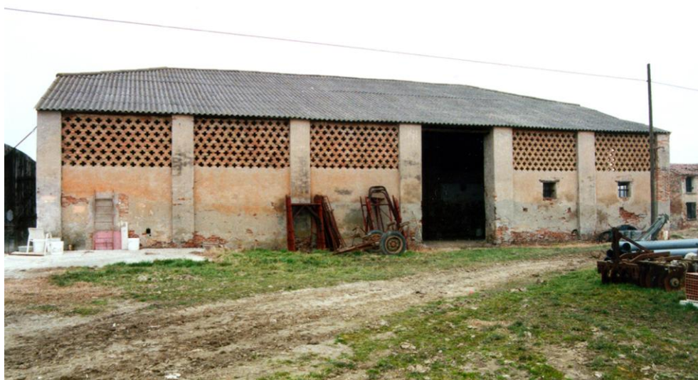
Oggetto Fabbricato ad uso ex stalla-fienile (4): fronte sud