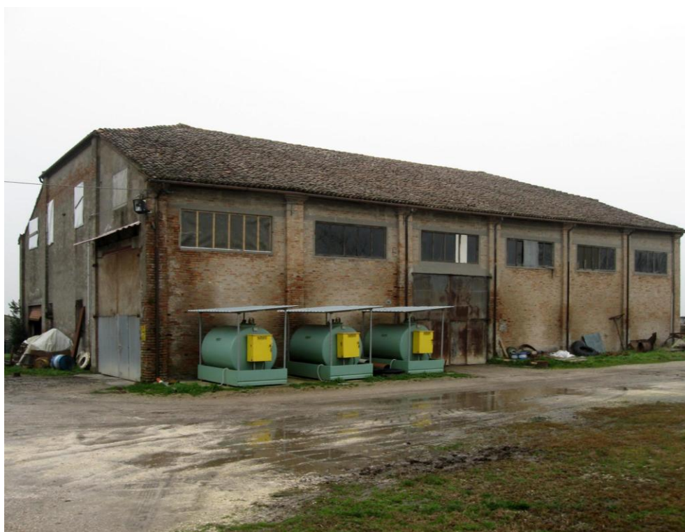
Oggetto Fabbricato ad uso ex stalla-fienile (10): fronte ovest