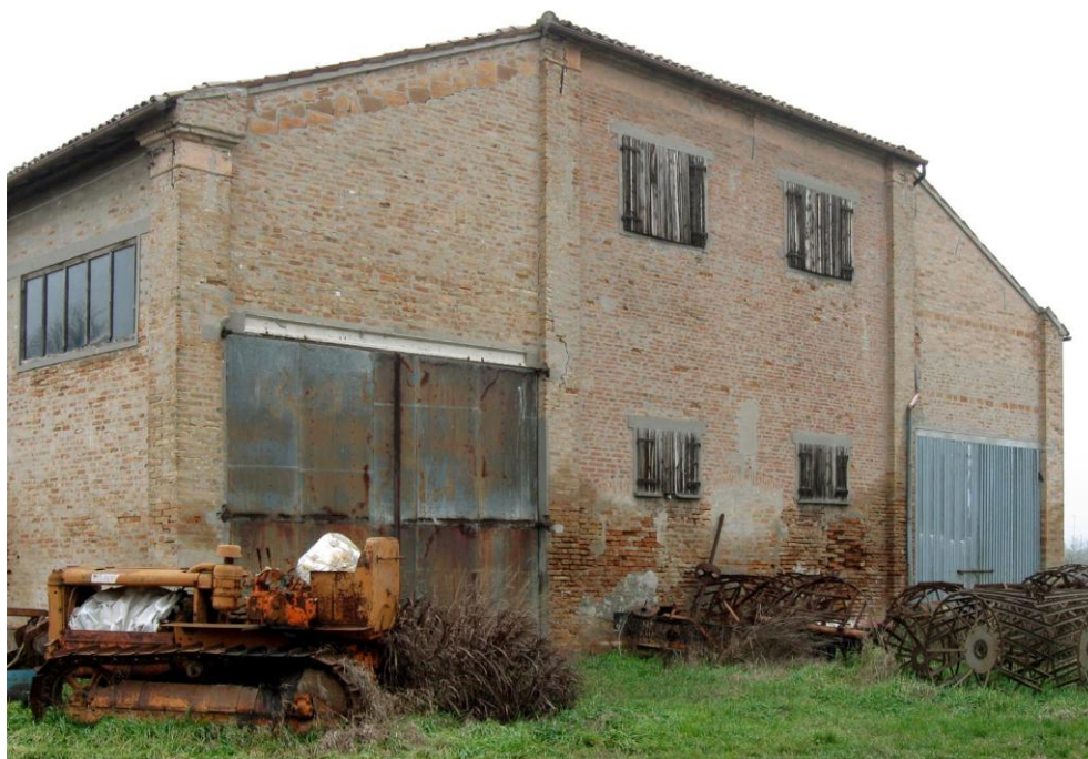
Oggetto Fabbricato ad uso ex stalla-fienile (10): fronte sud