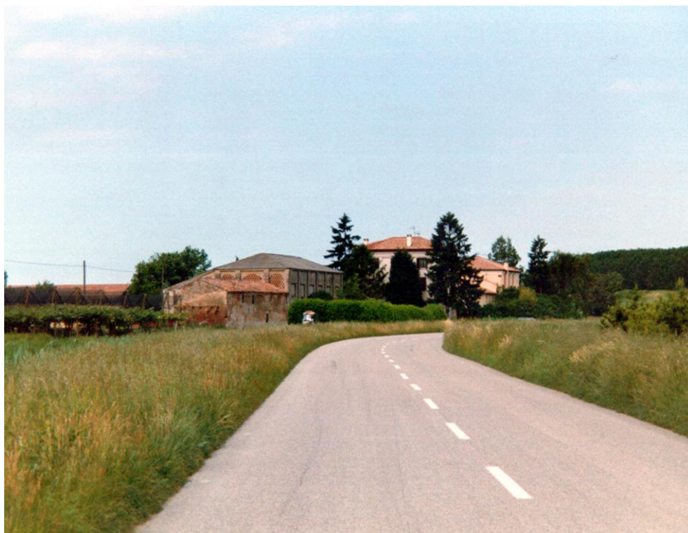
Oggetto Vista panoramica della corte