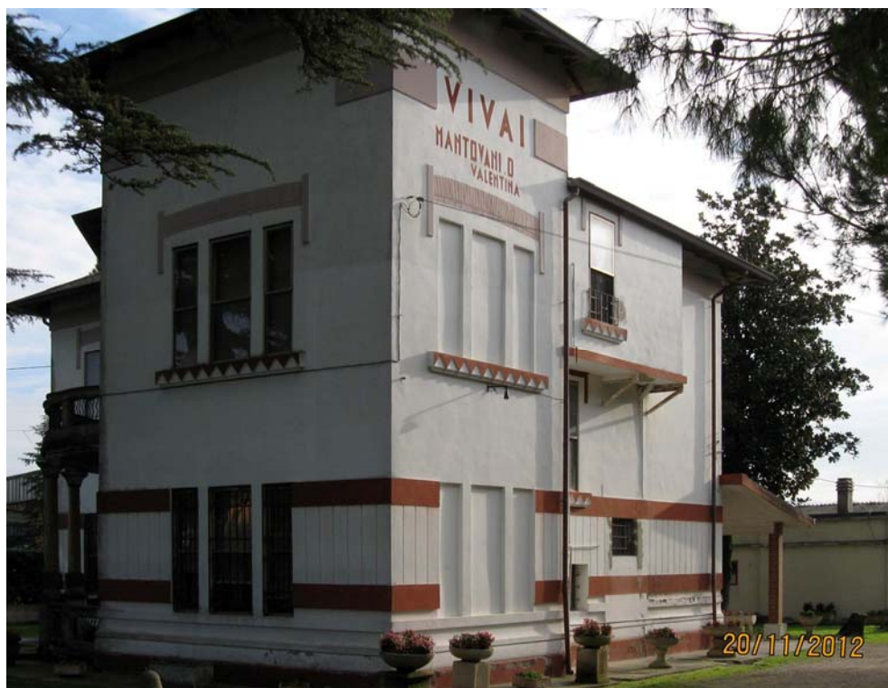
Oggetto Fabbricato ad uso abitazione (1): fronti nord-ovest e sud-ovest