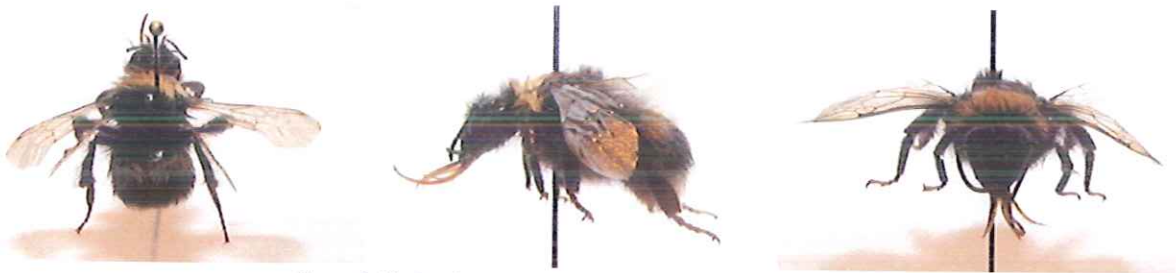
Figura 8-41: Bombus terrestris , femmina.