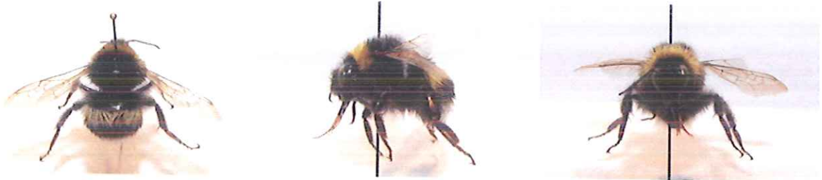
Figura 8-40: Bombus terrestris , maschio.